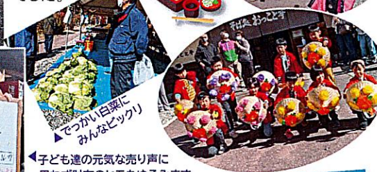
子ども達の元気な売り声に思わず財布のヒモゆるみます

店内でも県内外から来られた大勢のお客様が香り高い新そばを楽しんでいました。新そば祭りに関わられた皆さま大変お疲れ様でした。