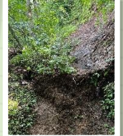
▼大久保汐 土手崩れ