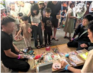
▼「誰が勝ち残るか！ジャンケン大会」

公民館運営委員で取りまとめ、参加している町のスポーツイベントです。乙事からは2チーム25名でエントリー。Aチームは総合3位、Bチームは2位ブロック中の4位でした。コロナ明けで運動不足のしょうもそうでないしょうも、終了後の焼肉とビールで、エネルギーをためた補充できたかや〜？