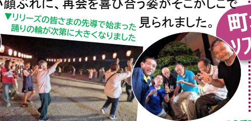
▲久しぶりの外飲み楽しそうですね！