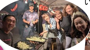
▲緑の下の力持ち、公民館運営委員の皆さま。何日も前から準備し、当日はもちろん翌日の後片付けまで本当にお疲れ様でした。