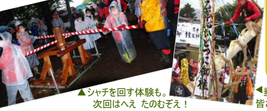
シャチを回す体験も。次回はへえ たのむぞえ！