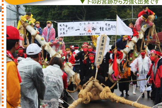
▼下のお宮跡から強く出発です 子ども達もメドに乗って、サマになってますね▼