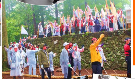
これが御柱の花形だ！